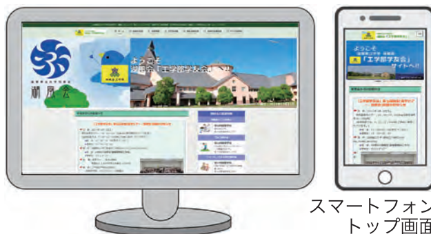
パソコントップ画面