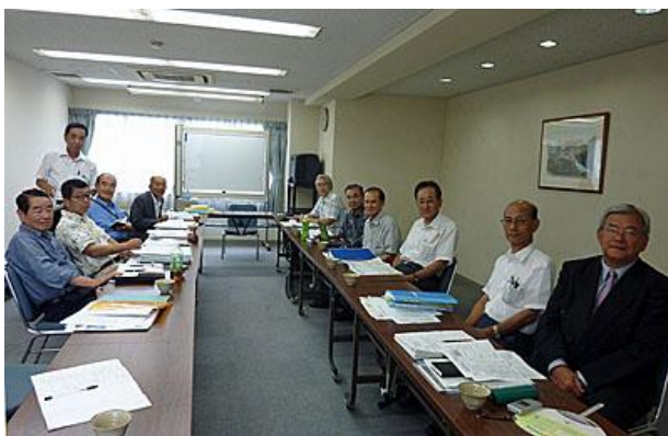
合同「幹事会」に出席の皆さん

次回幹事会 日時：平成23年10月2日（日）10：00～ 場所：パナソニックリゾート大阪 次回も、 工学部学友会準備チームとの合同会議 となります。