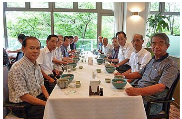
レストランで昼食中の皆さん