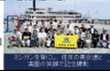
平等院を参拝し、往年の美女像と美画の美観で記念撮影

第11回開催日:2015(H27)年5月10日(日) コース:石山寺~宇治平等院を見て歩き 参加者:28名(男性18名、女性10名)