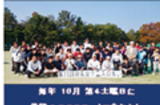
毎年10月第4土曜日に 母校のテニスコートで会いましょう！

第10回開催日:2014(H26)年10月28日(土) 場所:G-210 県大テニスコート、(湖風会)新酒造「小回り」 参加者:テニス OB 19名、県大生 19名 総観衆 OB 16名、県大生 14名