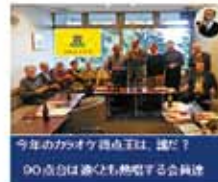
今年のカラオケ曲目王は、誰だ？ 90点台は進むも無難なる会員達

第9回開催日:2016(H28)年6月4日(土) 場所:京都植物園 参加者:8名