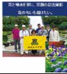
花と水を前に、笑顔の記念撮影 花の匂いも甘い。