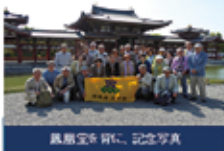
鳳凰堂参拝、記念写真

第11回開催日:2015(H27)年5月10日(日) コース:石山寺~宇治平等院を見て歩き 参加者:28名(男性18名、女性10名)